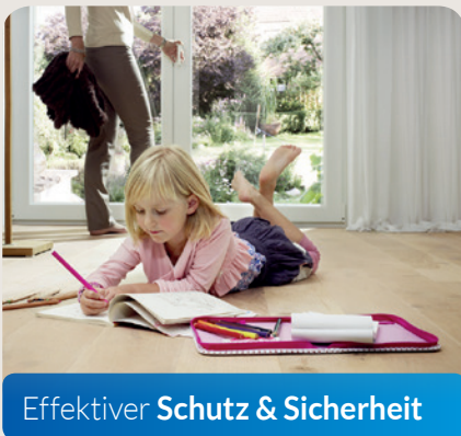
Effektiver Schutz & Sicherheit

Mit dem Select können Sie sich zu Hause sicher und geborgen fühlen. Sie sind gut geschützt – vor ungebetenen Gästen genauso wie vor extremer Witterung.